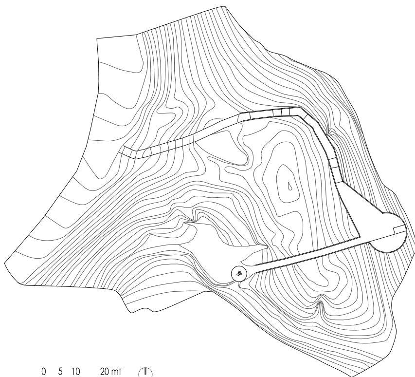
Monumento alla Resistenza di Cima Grappa Planimetria