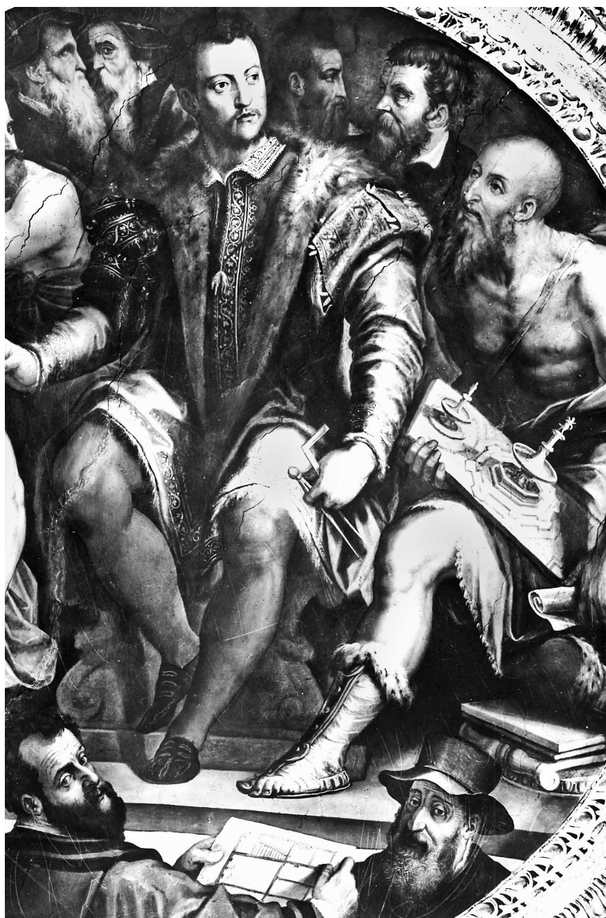
Fig. 6 G. Vasari, Cosimo I fra i suoi artisti e architetti , 1558 ca., Firenze, Palazzo Vecchio, sala di Cosimo I. Particolare.