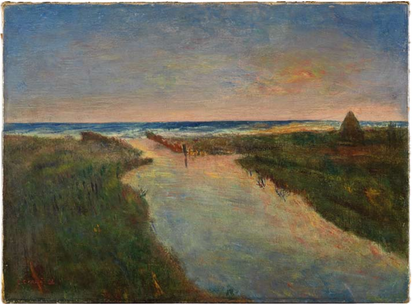
Carrà Carlo La foce del Cinquale 1928 olio su tela cm 63x85,5 Museo del Novecento, Milano © Comune di Milano - tutti i diritti di legge riservati © Mondadori PortfolioElecta/Luca Carrà Carlo Carrà Il Cinqualino olio su cartone telato cm 25x30 Fondazione di Studi di Storia dell'Arte Roberto Longhi, Firenze foto © Paolo e Claudio Giusti Lastra a Signa (FI) p. 68 Carlo Carrà Tramonto sul mare (La dogana), 1927 olio su tela cm 49,3x57,2 per gentile concessione della Galleria Internazionale d'Arte Moderna di Ca' Pesaro, Venezia foto Bohm 1989 © Archivio Fotografico Fondazione Musei Civici di Venezia p. 69 Carlo Carrà La segheria dei marmi 1928 olio su tela cm 69x89,5 già collezione Emilio e Maria Jesi, per gentile concessione della Pinacoteca di Brera, Milano pp. 72 -73 Casa in Versilia esterno, terrazzo, divano e camino foto Luca Carrà