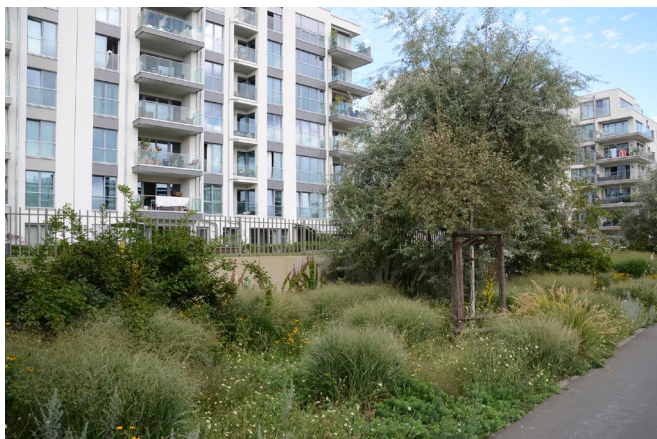
Fig. 5 – Berlino, ex-aeroporto Tempelhof. Riuso e riconversione della struttura aeroportuale in parco pubblico.

timento caro ai paesaggisti, in primo luogo legato alla categoria estetica del pittoresco, che rimanda quindi ai progettisti inglesi ottocenteschi, ma richiamato anche in epoca contemporanea da autori come Gilles Clément che invita a “mettere in atto lo spaesamento per un nuovo rapporto con la città” 4 . Lo spaesamento prodotto dalla crisi ambientale è però diverso, perché non è un dispositivo progettuale, quindi voluto, ma è subito e si lega al mutamento della relazione tra l'uomo e la Natura. Gli eventi atmosferici sono improbabili e spaesanti perché