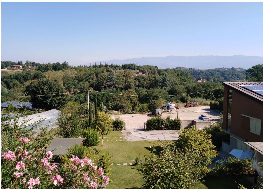
Fig. 1 – Stili di vita globalizzati. Nuovi abitanti di ogni latitudine amano vedere impeccabili prati verdi nei loro giardini: campagna toscana.