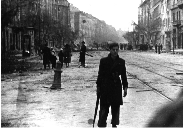
Fegyveres forradalmár a József körúton (ÁBTL 4.1. A-1265)

mozók) számára egyaránt a tipikus pesti srác, a harcos képi megfogalmazásaként hathatott, amelyet a felismerhető hadieszközök, s különösen az azonosítható helyszín hitelesített. 50