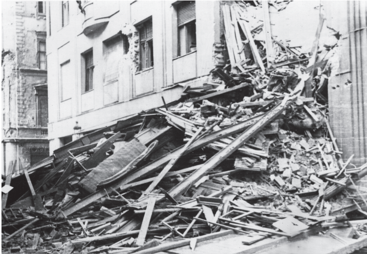
Romos lakóház a Baross és a Mária utca sarkánál (ÁBTL 4. I. A-1265)

elindultam az Üllői út felé. A lezajlott csata nyomán hihetetlen látvány fogadott. A pár napja még békés utcaképnek nyoma sem volt többé. A házakon belövések sebhelyei, golyónyomok, leszakadt felsővezetékek, páncélautók, kiégett harckocsik, személyautók roncsai mindenfelé. A Kiliánlaktanya környékén nagy embercsoportok vették körül a felkelőket. Az előmerészkedő lakosság lassan ellepte az utcákat.” 46