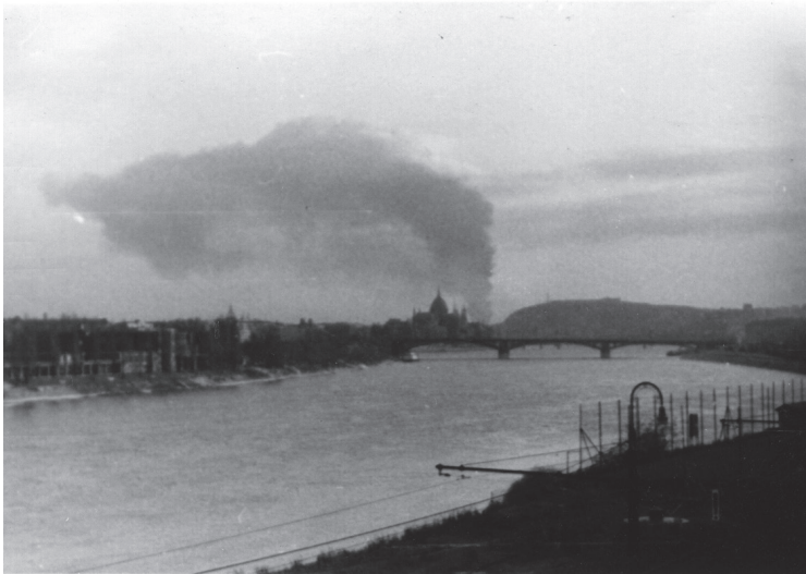
Budapest látképe füstfelhővel (ÁBTL 4. I. A-1265)