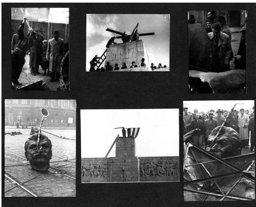
A Sztálin-szobor rombolásának stációi az album egyik oldalán: maradványok a Felvonulási és a Blaha Lujza téren, darabolása az Akácfa utcában (ÁBTL 4.I. A-1265)

„detektívvé”, 11 addig ’56 fotóit a város színpadának hirtelen átrendezett és merőben új díszlete teszi „vadásszá” vagy éppen „csak” tekergővé, olyanná, aki hagyja magát az események sodrában hanykolódni, és engedi, hogy vezessék szemét, kezét (kameráját) a látottak. 12 Azonban ez a passzívabb habitus sem „védi meg” a résztvételtől. Hasonlóan „keveredik bele” az eseményekbe, mint a forradalmat verbálisan rögzítő, azokra emlékező naplói. Horváth Sándor e doku-