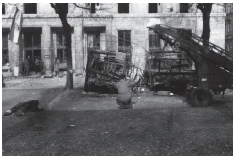
Fényképész a Köztársaság téren az ostrom után