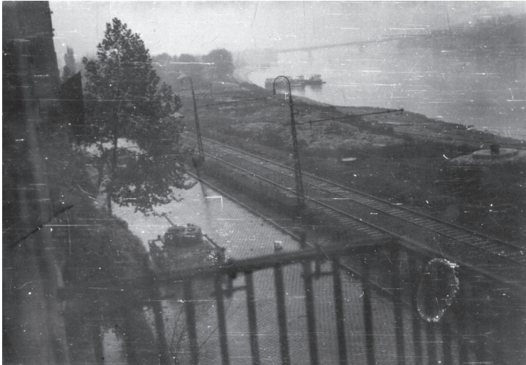
Erkélyről készített felvétel az Árpád fejedelem úton haladó szovjet T-54-es harckocsiról (ÁBTL 4. I. A-1265)