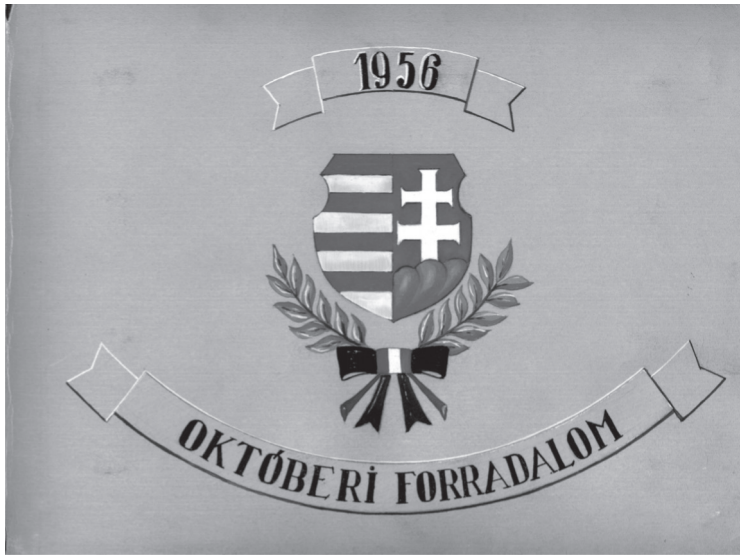
Az album kézzel festett előlapja (ÁBTL 4. I. A-1265)

utcakép újabb és újabb részleteit hódítja meg az erőszak szimbolikus aktsaival (könyvégetések, feliratok) és a háborús borzalmakkal (emberi áldozatok, belövést kapott lakóházak, szétroncsolódott járművek). 1956 ismeretlen képi elbeszélője, aki saját adatgyűjtésével (fényképezés) részben szereplője is történetének, az önéletírókhoz hasonlóan jár el, amikor bár névtelenül, de az egyedi készítésű borítón címadásával paktumot ajánl fel a képolvasó számára: ez kifejezetten az „októberi forradalom” (és nem az ellenforradalom) valóságos látványvilága. 7 Retrospektív szemszögből alkotja újra az életút egy fontosnak ítélt eseményét, eseménysorát, amelyet a kronologikus és a tematikus tengely mentén strukturál. Az időbeni előremutatások, visszatérések, témaelágazások, érezhető hiányok ellenére a megszerkesztett narráció