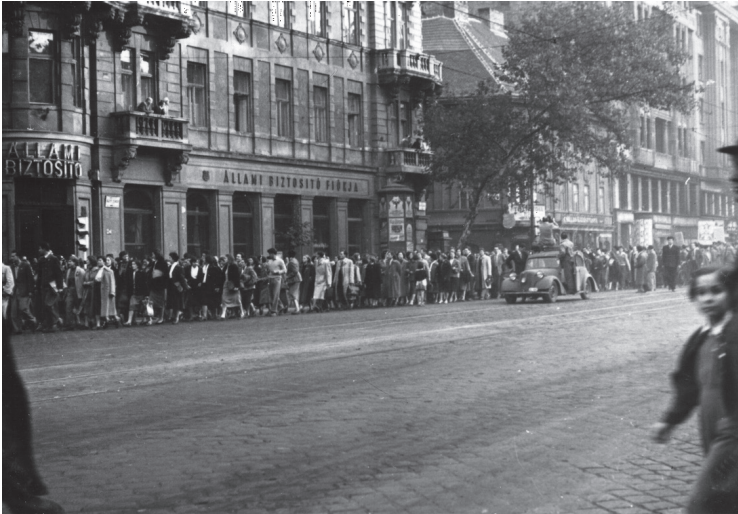
Tüntető és az őket filmező híradós kocsí a Bajcsy-Zsilinszky út elején 1956. október 23-án

hatók a lengyel–magyar barátságot éltető transzparensok, sőt egy a felvonulókat filmező forgatócsoport is, amely gépkocsin kísérte a menetet.