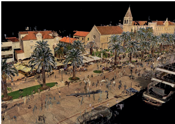
↑ Vista della nuvola di punti del waterfront di Trogir. Point cloud view of the Trogir waterfront.