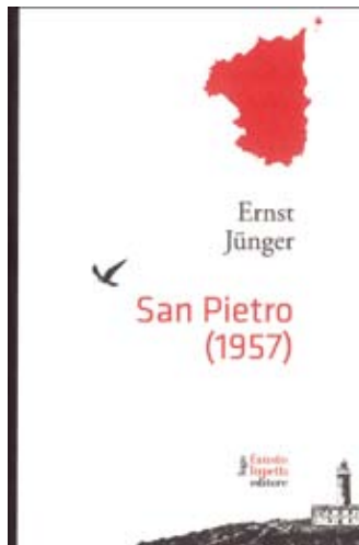
Ernst Jünger San Pietro (1957) Fausto Lupetti Editore, Bologna 2015 ISBN: 9788868740757