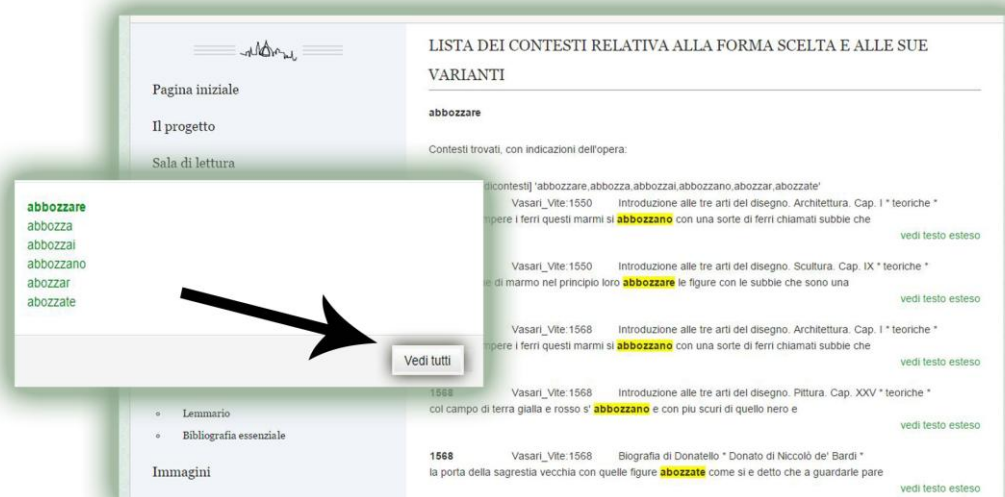
Fig. 1: Lemmario : selezione delle forme e visualizzazione dei contesti associati