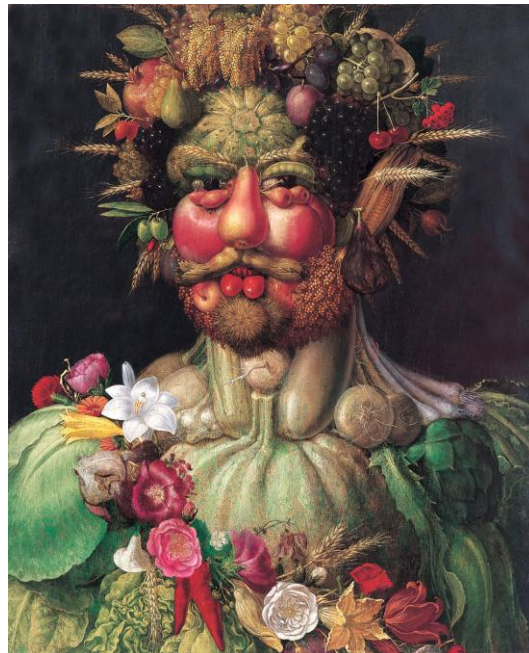
Fig. 3: Giuseppe Arcimboldi, Vertumno , 1590, Stoccolma, Skoklosters slott.