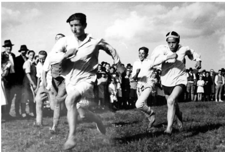
Csíkszentmártoni fiúk a rajoni futóversenyen.

1953. május 24-én, pünkösd vasárnap a MAT 507 községi művelődési házában (kulturóthonában) az aktivisták előadást tartottak A Vatikán, az angol-amerikai imperializmus lakája címmel. 69 A kitűzött célt utólag elértnek minősítették, bár nem hiányozhattak az ellenséges megnyilvánulások iránti éberségre vonatkozó bírálatok: