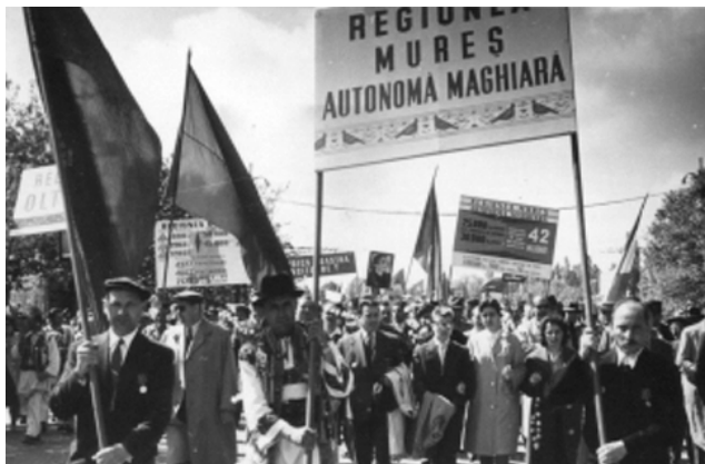
Felvonulók a Maros-Magyar Autonóm Tartományban

köztük Münnich Ferenc miniszterelnök is Romániában tartózkodott – a hivatalos közlés szerint szabadságukat töltötték. 250 Bár írásos bizonyítékkal nem rendelkezünk ezen elmélet alátámasztására, valószínűnek tűnik, hogy a negatív magyar reakciók hatására Gheorghiu-Dej a fokozatosság elvét érvényesítette a MAT felszámolásában. Ténylegesen azonban körülbelül egy év leforgása alatt mindazokat, akik az 1957-ben elindított tisztogatások után helyi szinten még a vezetőségben maradhattak, szisztematikusan, csendben, de eltávolították a hatalomból.