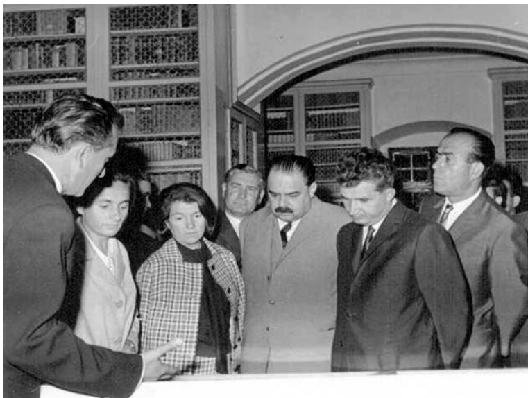
Fazekas János és Nicolae Ceaușescu a marosvásárhelyi Teleki Tékában

san építette azt a patrónus-kliens viszonyrendszert, amelynek köszönhetően gépkocsik (az ún. „Trabant-repartíció), televíziók és Magyarországra szóló turistaútlevelek álltak rendelkezésre a magyar párhivatalnokok és a szocialista kulturális rendszerbe (pl. Írószövetség, vezető művészek) integrált értelmiségiek számára. 65