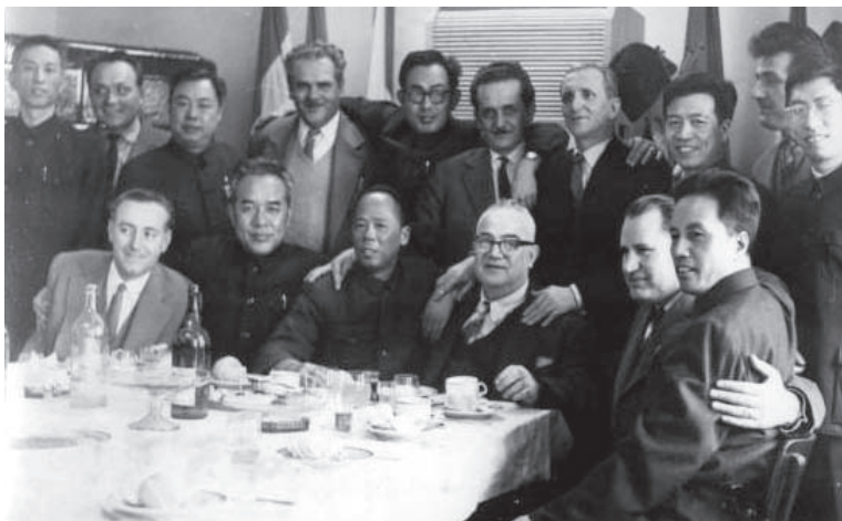
Szovjet látogatók a Magyar Autonóm Tartományban, 1956

Győző és mások által támadott mű nem volt más, mint a felszabadulás utáni vidéki élet első hiteles, nem sablonos ábrázolása. Másfelől oldódni látszott a MAT korábbi elszigeteltsége: május folyamán a Vörös Zászló büszkén jelentette, hogy Marosvásárhelyre látogat a Burját-Mongol Köztársaság egészségügyi minisztere és a Kirgiz Tudományos Akadémia elnöke 30 , majd júniusban a svájci Gazette de Lausanne tudósítója, szeptemberben pedig Pierre Dronin, a Le Monde újságírója, akit elragadott Marosvásárhely tisztasága és vidámsága. 31 Ugyanakkor a Magyar Autonóm Tartomány újságírói is utazási engedélyt kapnak: szeptember 26-án „Marosvásárhelyről Prágáig” címmel hosszú riportot jelentett meg a helyi napilap munkatársa, aki a (Budapesten át közlekedő) Bukarest–Prága Orient Expressz nemzetközi gyorsvonattal jutott a csehszlovák fővárosba.