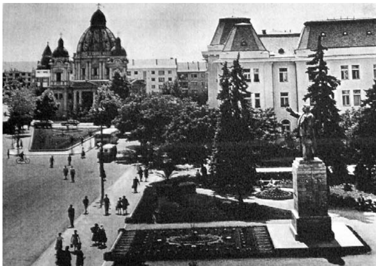
Marosvásárhely főtere az ötvenes években Sztálin-szoborral