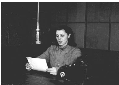
A román rádió területi stúdiója Marosvásárhelyen

Romániában Petru Groza korábbi kormányfő 1958. január 7-én bekövetkezett halálával az erdélyi magyarok és különösen a székelyek a legbefolyásosabb bukaresti román „patrónust” veszítették el. A Kádár-kormány külpolitikai súlytalansága és a szovjet csapatok kivonulása pedig kedvezőbb feltételeket garantált a román államépítési projekthez. A MAT vezető testületei iratainak vizsgálatából kiderült, hogy miközben igyekeztek folytatni a korábban elkezdett munkát (1958. március 2-án indult Marosvásárhelyen a rádió területi stúdiója, 115 tavasszal jelent meg a Sütő András vezette Művészet című képes folyóirat 116 ), a legtöbb területen visszavonulót fújtak, és soha nem látott szorgalommal követték a központ utasításait.