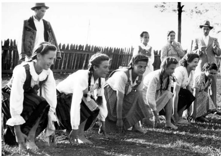
Csíkmadarasi lányok a rajoni futóversenyen

A MAT nem volt színhelye, nem adott keretet egy koherens társadalmi projektnek. Különleges figyelemben részesült azonban a „magyar üvegház” olyan területeken, amelyek nem a termeléshez, hanem inkább a szabadidő eltöltéséhez kapcsolódtak: a kultúra, a sport, a „hasznos” kikapcsolódás terén a hagyományosan elszigetelt és elmaradott régió lakosai csak az ötvenes évektől kezdtek el fogyasztani modern kulturális termékeket: moziba járás, cukrászda és vendéglő látogatása (kávézás, flekkenezés), sportesemények megtekintése és a sportgyakorlás, motor- és autóversenyek, koncerten való részvétel, rádióhallgatás, kiránduláson vagy szervezett utazáson való részvétel.