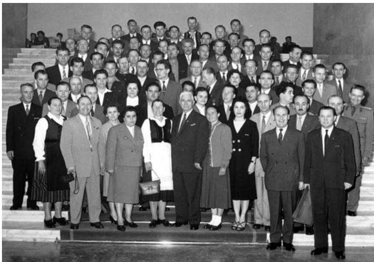
Pártértekezlet a Magyar Autonóm Tartományban