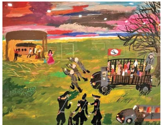
17. Ceija Stojka, Arresto e deportazione, 1995. Museo Nacional Centro de Arte Reina Sofía, Madrid.