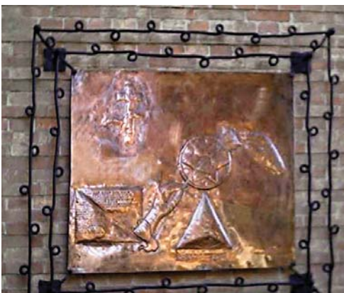
6. Padova. Targa in bassorilievo in memoria di tutti i rom e sinti internati nei campi di concentramento durante la Seconda Guerra Mondiale.