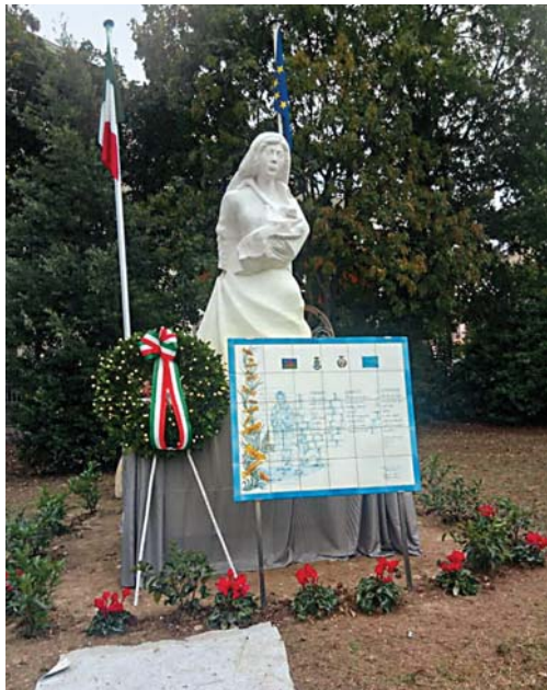
10. Lanciano (Chieti). Monumento al Samudaripen dei rom e dei sinti.