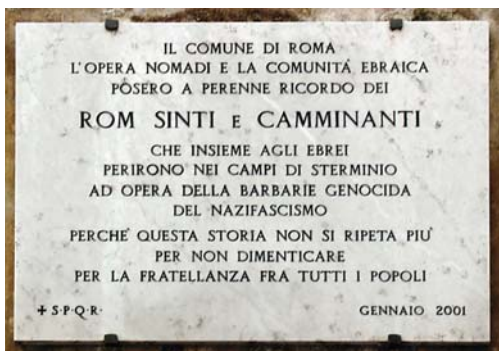
12. Roma. Targa in memoria di rom sinti e caminanti vittime dello sterminio.