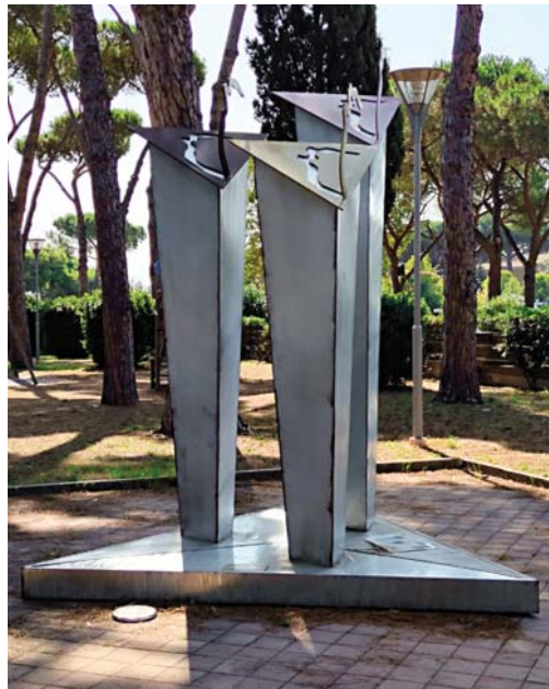
11. Roma. Monumento in ricordo delle vittime ebrae, rom e omosessuali dello sterminio.