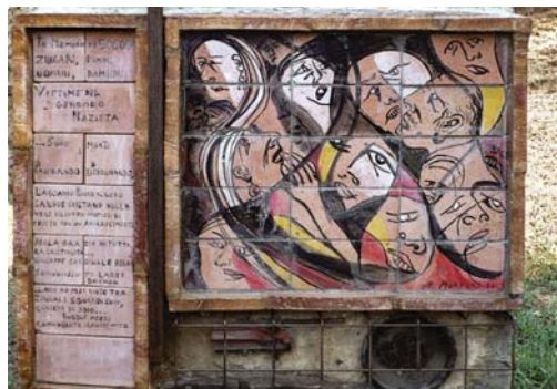
13. Roma. Santuario degli zingari dedicato alla memoria di cinquecentomila donne, uomini e bambini rom e sinti, vittime del genocidio nazista e al beato kaló Zefferino Jiméz Malla.