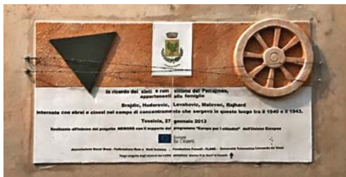
9. Tossicia. Targa in memoria dei rom e dei sinti deportati dal fascismo e dal nazismo nel luogo in cui sorse il campo di concentramento di Tossicia.