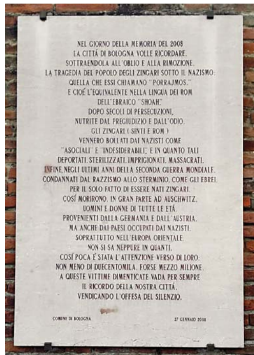
8. Bologna. Targa in memoria di rom e sinti vittime dello sterminio.