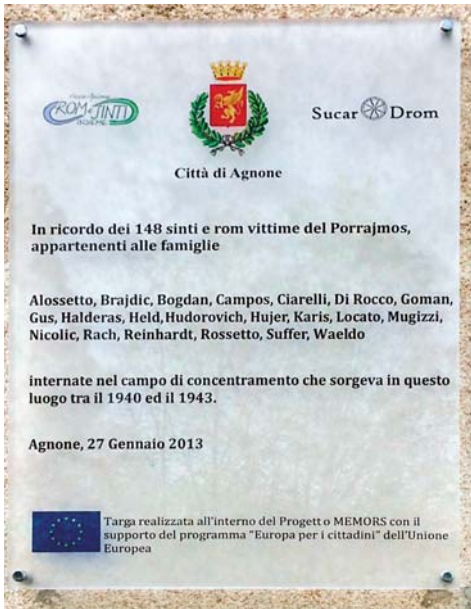
14. Agnone (Isernia). Targa in memoria dei sinti e dei rom deportati dal fascismo e dal nazismo nel luogo in cui sorse il campo di concentramento di Agnone.