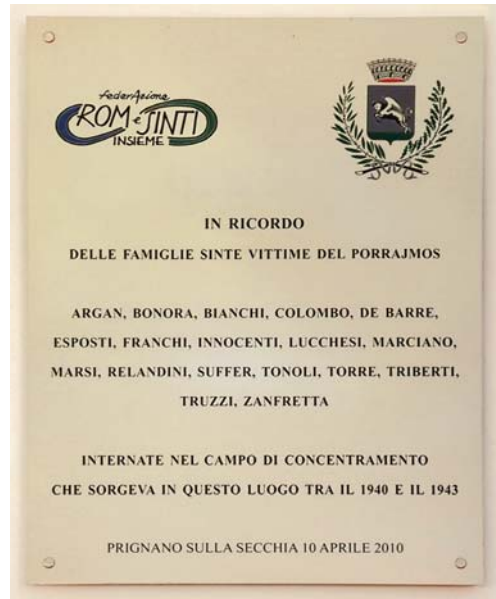
7. Prignano sulla Secchia (Modena). Targa in memoria dei rom e dei sinti deportati dal fascismo e dal nazismo nel luogo in cui sorse il campo di concentramento di Prignano.