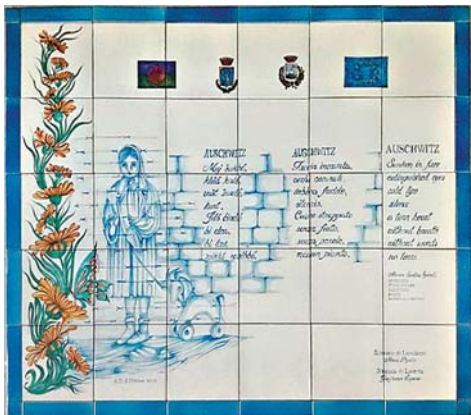
16. Laterza (Taranto). Targa che riporta la poesia «Auschwitz» di Santino Spinelli.