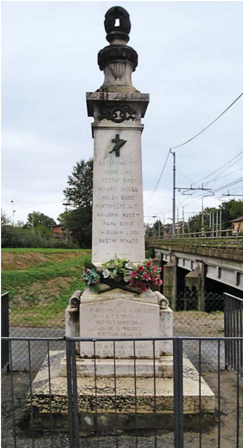
5. Vicenza. Monumento dei dieci Martiri di Vicenza.