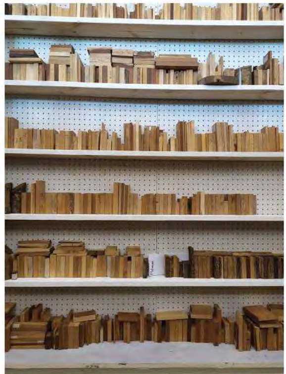
Fig. 1 Dettaglio della collezione di legni ordinata nelle nuove scaffalature realizzate presso l’Erbario Centrale Italiano di Firenze (FI).