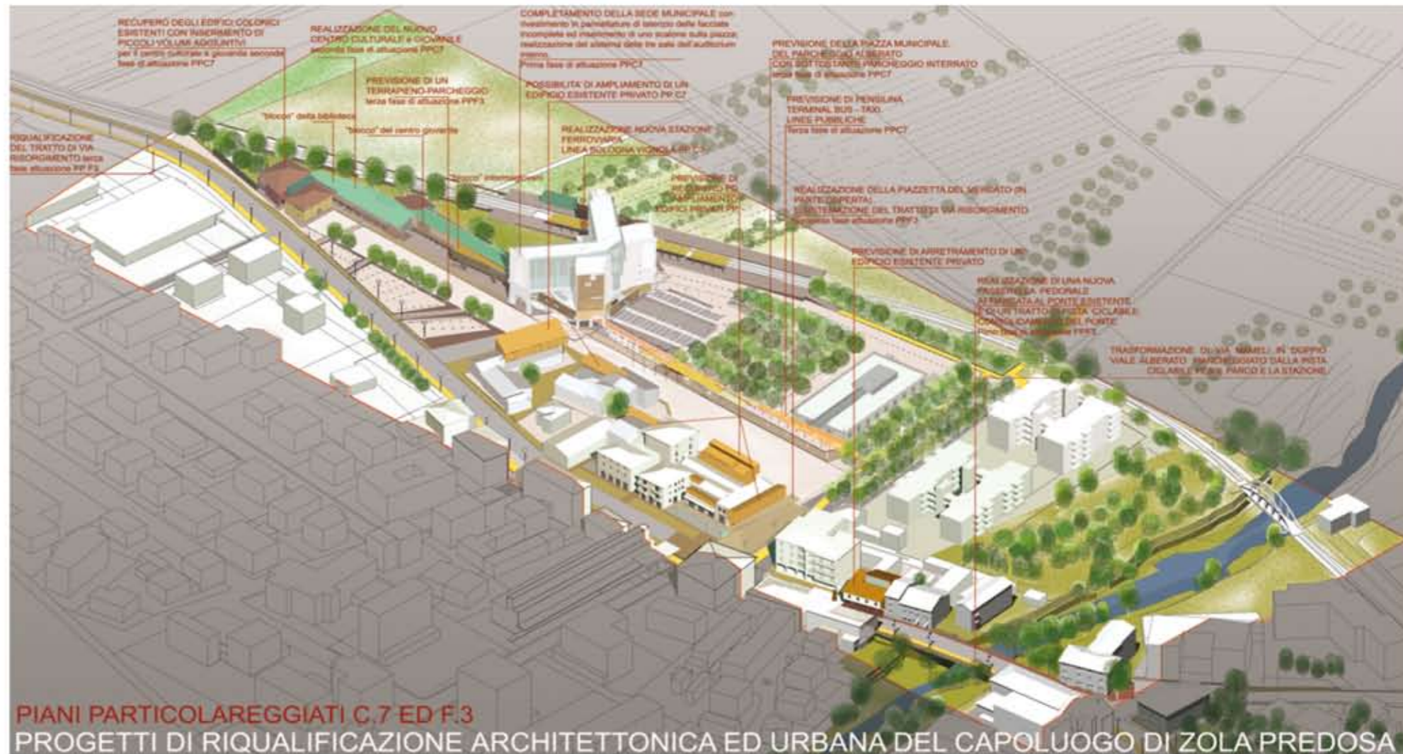
PIANI PARTICOLAREGGIATI C.7 ED F.3 PROGETTI DI RIQUALIFICAZIONE ARCHITETTONICA ED URBANA DEL CAPOLUOGO DI ZOLA PREDOSA