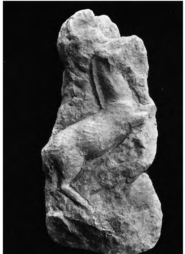
Fig. 10. Rilievo neoattico non finito, dettaglio b. Pireo, Museo Archeologico (da: Blümel 1927, tav. 37).

tà – esclusa negli studi più recenti – che di esso facesse parte anche un’Atena incedente, che si lanciava lateralmente in un balzo conseguente alla propria portentosa apparizione dalla testa di Zeus, e che essa avesse ispirato la citazione sul puteale di Madrid e la stessa statua capitolina.