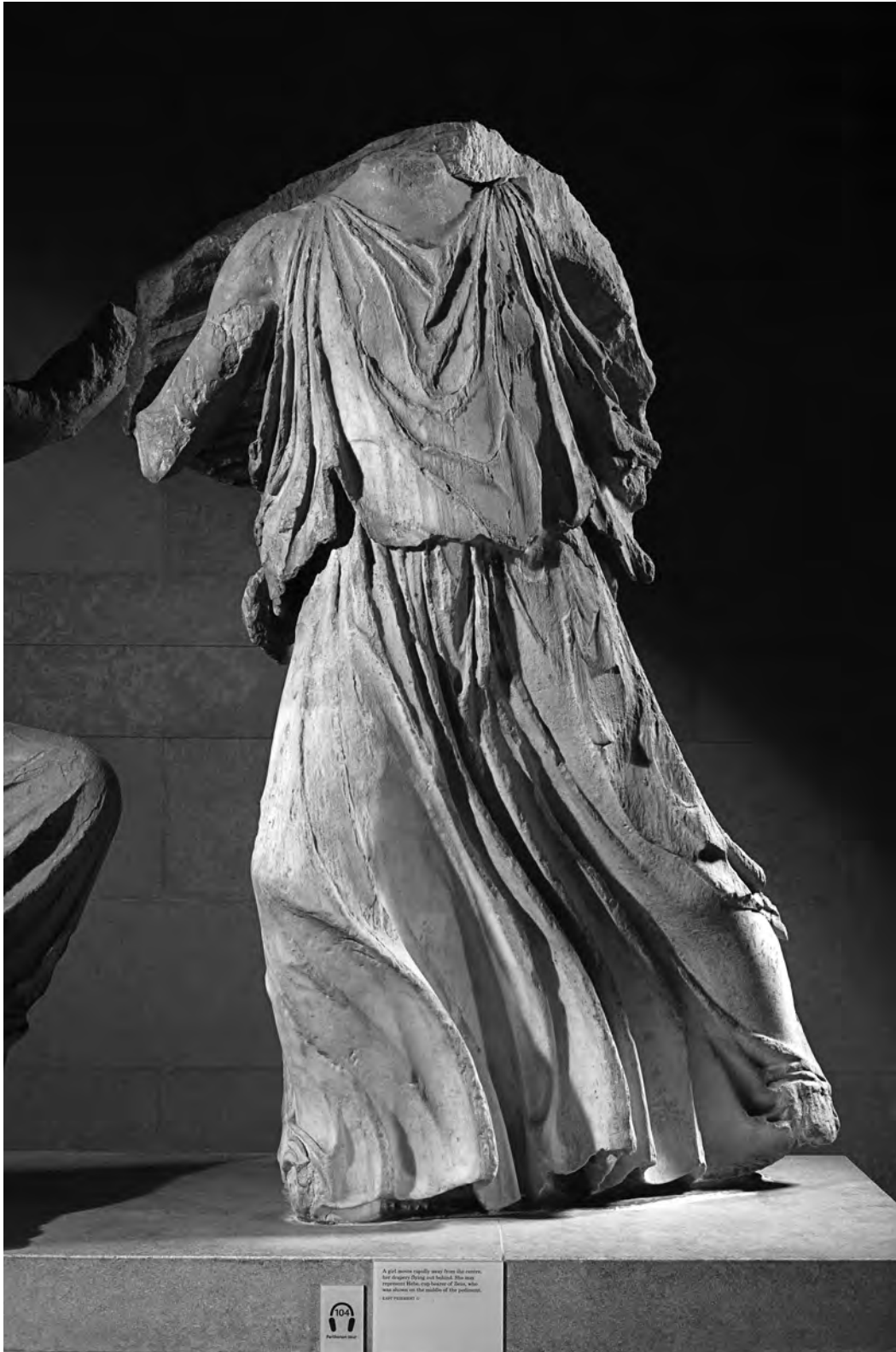
Fig. 6. Frontone orientale del Partenone, figura G. Londra, Museo Britannico.