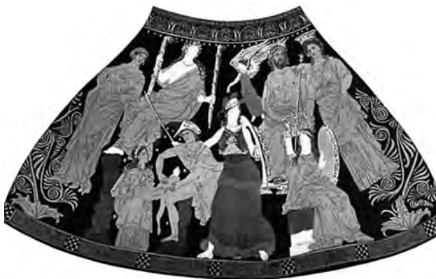
Fig. 8. Pelike: dettaglio. San Pietroburgo, Museo dell'Ermitage, n. inv. St 1792.