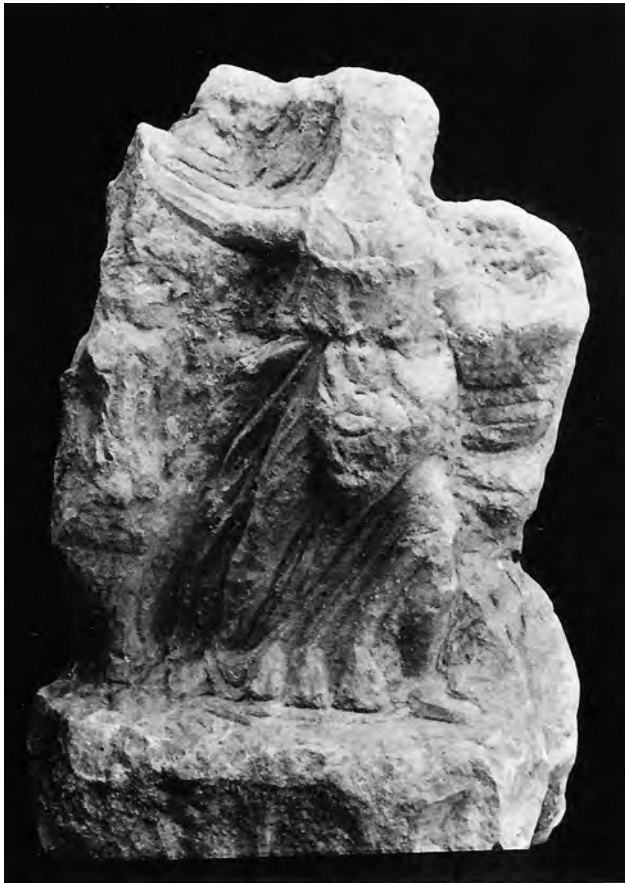
Fig. 9. Rilievo neoattico non finito: dettaglio a. Pireo, Museo Archeologico (da: Blümel 1927, tav. 37).