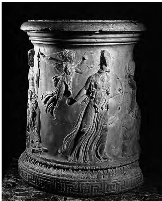
Fig. 7. Puteale neoattico con la nascita di Atena: dettaglio. Madrid, Museo Nazionale.

Non è questa la sede adeguata per affrontare nel dettaglio la questione della ricomposizione del gruppo frontonale perduto. 29 Ci si limiterà dunque a riconsiderare la possibili-