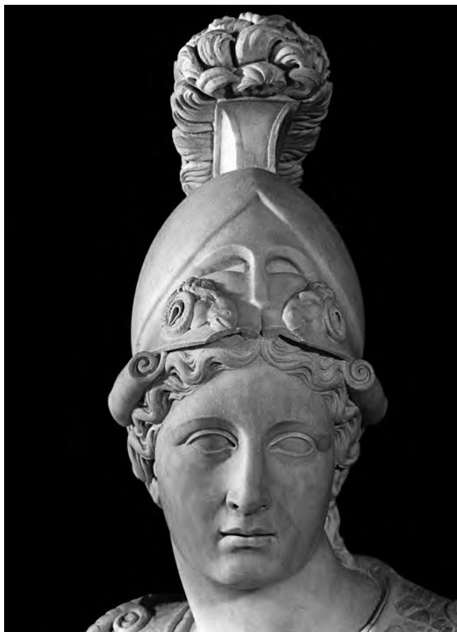
Fig. 4. Statua di Atena: dettaglio della testa. Roma, Museo Capitolino, Salone.

seo di Tripolis, anch'essa datata ad età claudia. 11