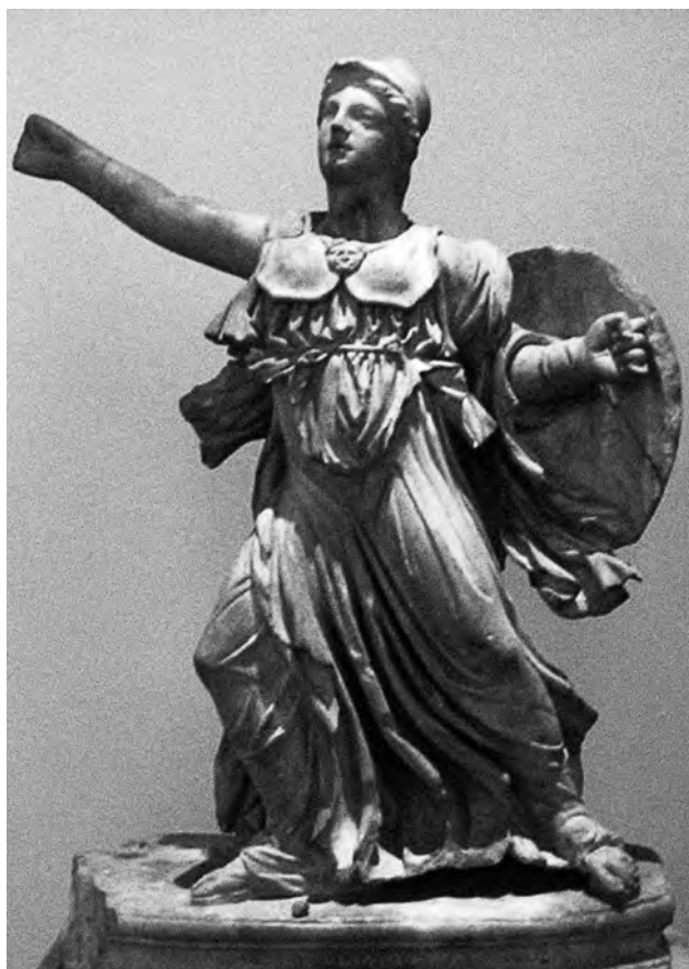
Fig. 11. Statuetta da Epidauro. Atene, Museo Archeologico Nazionale, n. inv. 275.

Per datare l'originale scultoreo che ha ispirato queste rivisitazioni ci soccorre l'analisi stilistica, in particolare delle immagini di Nikai, spesso rappresentate in corsa e dunque ben confrontabili per panneggio e posizione con il tipo iconografico qui discusso. Già A. Gulaki segnala come il frontone Est del Partenone, almeno attraverso la figura femminile G giunta sino a noi (ma, aggiungiamo, probabilmente anche con l'Atena oggi perduta), avesse rappresentato il canone per la rappresentazione della corsa laterale. 36 Nella seconda metà del V secolo il motivo diviene dunque sempre più popolare per figure incedenti vestite di peplo, che non di rado si apre su una delle gambe. 37 Per il decennio 430-420 a.C. diviene molto caratteristica una diversità di trattamento tra le gambe, visibili grazie al vento che fa aderire il panneggio alle forme, e la resa del peplo che ricade in ricche falde, separate da ampi avvallamenti: proprio come avviene sulla scultura capitolina. 38 Nei de-