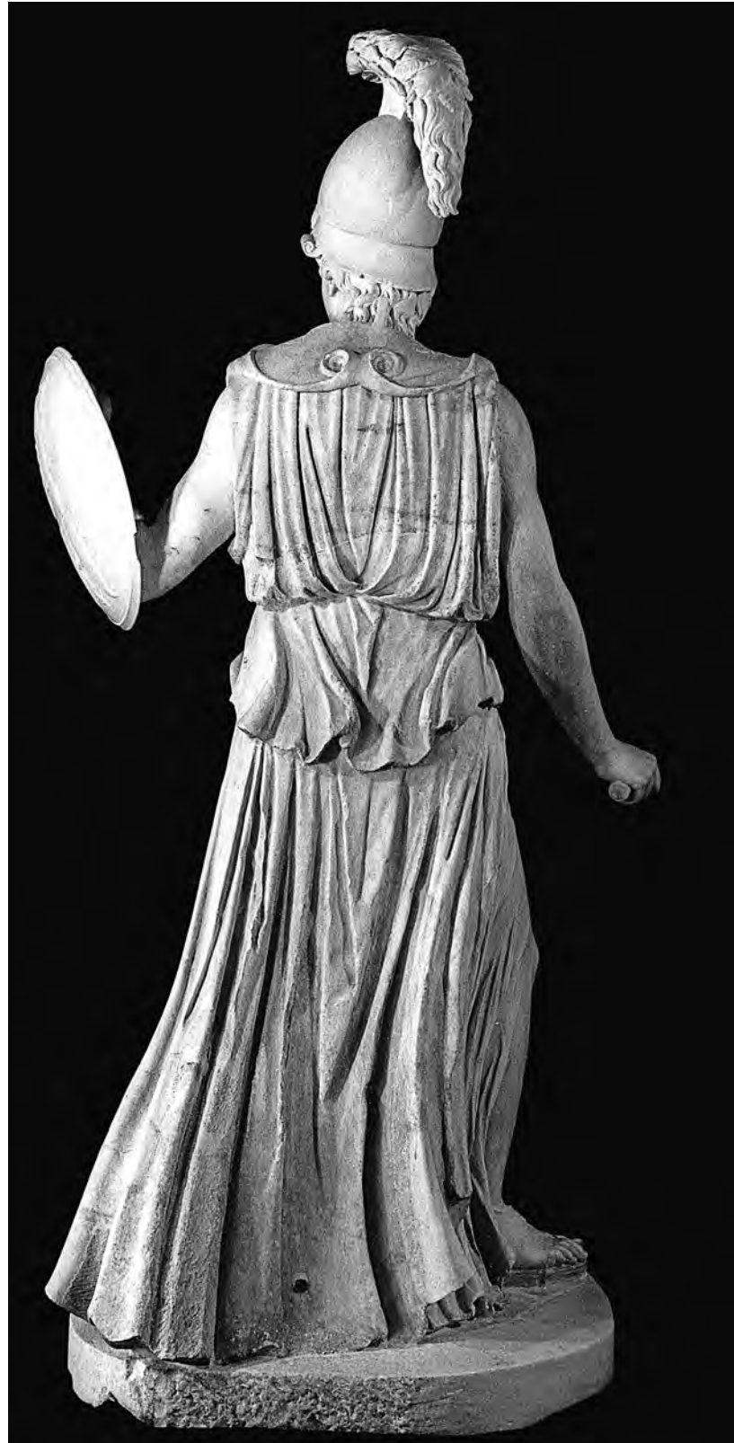
Fig. 3. Statua di Atena: veduta posteriore. Roma, Museo Capitolino, Salone.