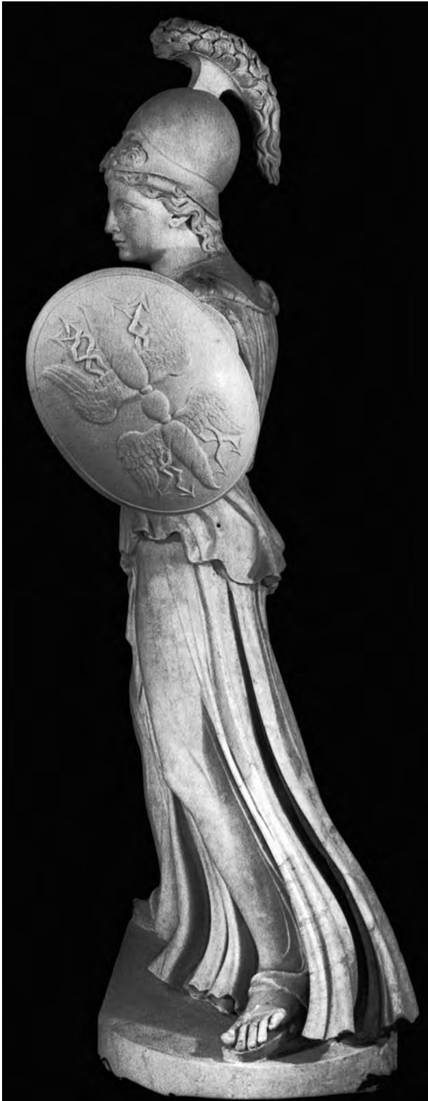
Fig. 2. Statua di Atena: veduta lato sinistro. Roma, Museo Capitolino, Salone.