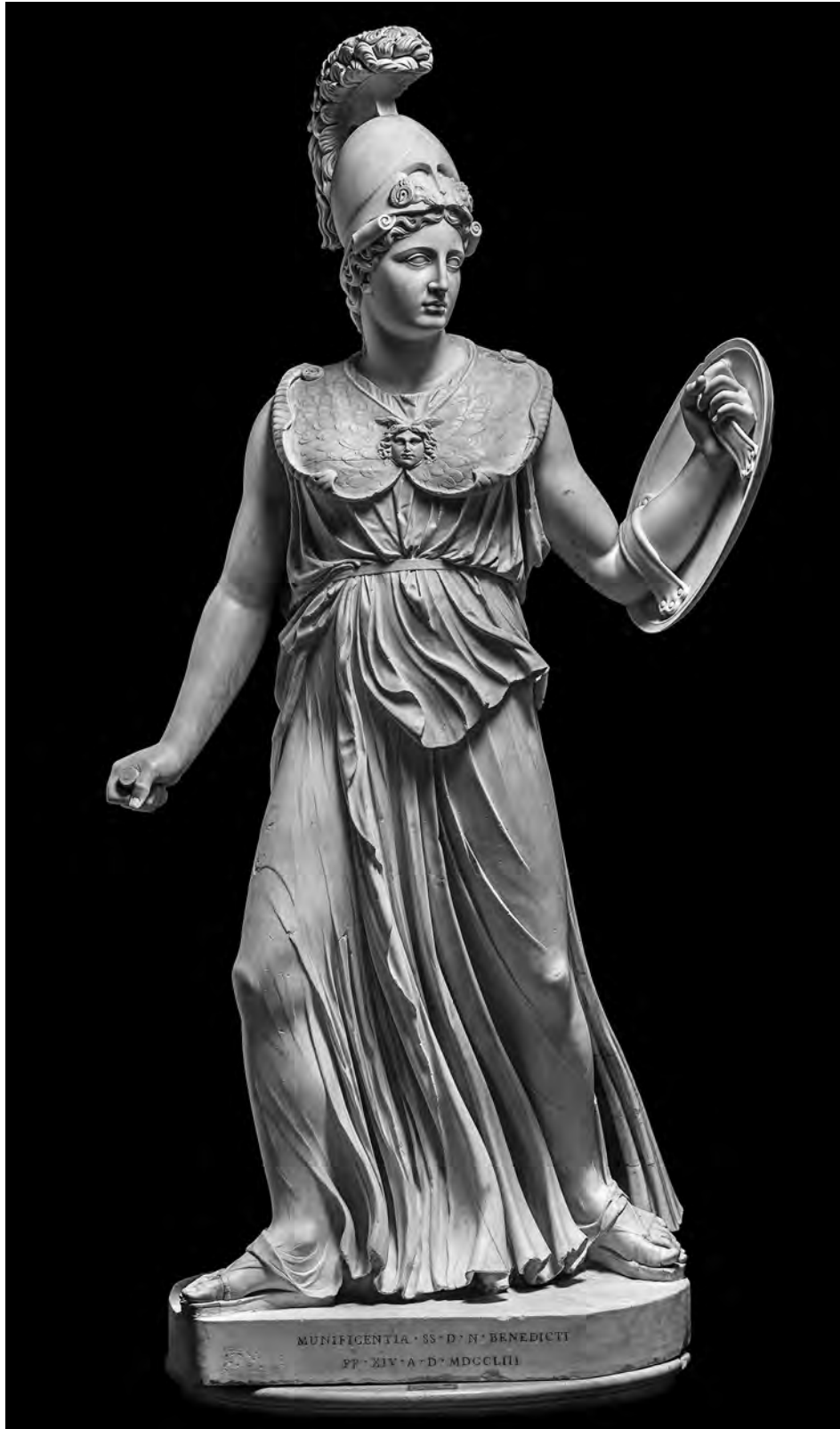
Fig. 1. Statua di Atena: veduta frontale. Roma, Museo Capitolino, Salone.