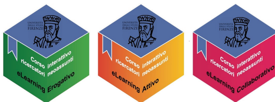
Figura 2 – Moodle Badge per unità eLearning erogativo, attivo, collaborativo