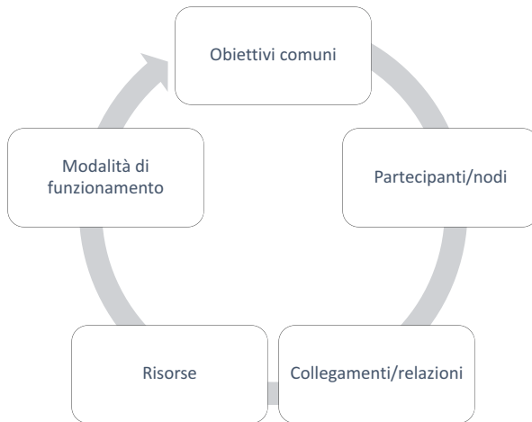
Figura 2 – Gli elementi di una rete (rielaborazione a partire da Consolini, 2009)

cisione di fare qualcosa insieme per raggiungere risultati condivisi in risposta a problemi e bisogni ritenuti significativi per i partecipanti. È su questa base che il mondo del lavoro, le imprese, i soggetti istituzionali possono dare un senso alla propria collaborazione con la scuola. In questa prospettiva “lavorare in rete” significa superare collaborazioni episodiche e strumentali per andare verso una reale sinergia e integrazione degli interventi. Tale integrazione si fonda su una condivisione di valori ed un clima di fiducia e affidabilità reciproca tra i diversi attori, una convergenza di linguaggi, metodi e tecniche, facilitata dalla presenza di ruoli di integrazione che assicurino la circolazione della comunicazione, la coerenza e la continuità. Lavorare in rete non “serve”, dunque, alla realizzazione di un progetto, ma è un approccio e una modalità operativa o piuttosto un processo graduale (Figura 3) che, come sottolineato nei documenti, corresponsabilizza le comunità rispetto ai processi di apprendimento degli studenti.