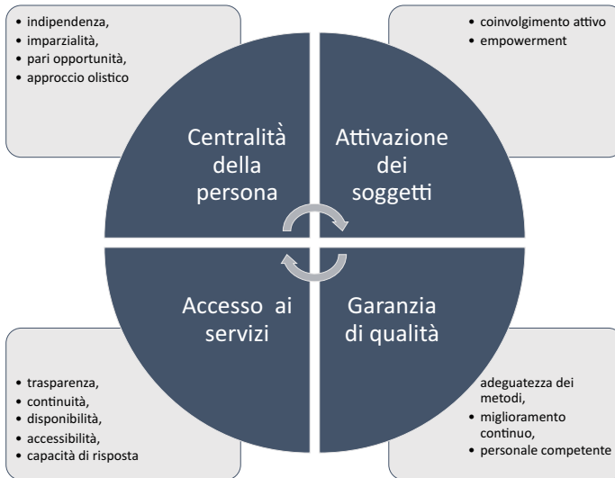
Figura 1 – I principi e le parole chiave dell'orientamento (rielaborazione grafica dell'Autore a partire da ELGPN, 2012)

Attualmente la situazione in Europa è molto eterogenea da almeno tre punti di vista (Kraatz, 2015; WGCG, 2021) per pluralità di visioni e significati, livelli e modalità di inclusione nei curricula scolastici; formazione dei professionisti (Cfr. Cap. 4). Mentre ci sono Paesi come Malta o la Norvegia, dove l'importanza di insegnare Career Management Skill a partire dalla scuola primaria è riconosciuta da diversi anni con politiche e misure ben definite, in altri paesi, tra cui l'Italia, l'orientamento pur previsto dalla normativa, è ancora realizzato attraverso progetti e attività circoscritte, strutturato prevalentemente in ottica informativa, ancora sporadico e frammentato. Negli ultimi due