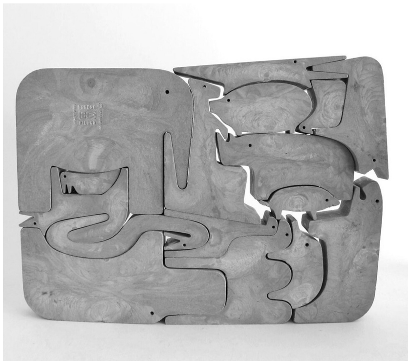
Fig. 3. Enzo Mari, 16 animali , 1957, Danese Milano, puzzle in legno massello di rovere.

La riflessione si sposta così sui percorsi dell'immaginazione, capaci di superare ostacoli fisici o pregiudizi mentali, per svelare connessioni tra culture materiali poste agli antipodi attraverso passi mossi su assi gemelli tra un Nord e un Sud ancora troppo poco valutati come aree di somiglianza. Perché è il punto di incastro tra le cose diverse a generare oggetti di straordinaria bellezza (fig. 3).