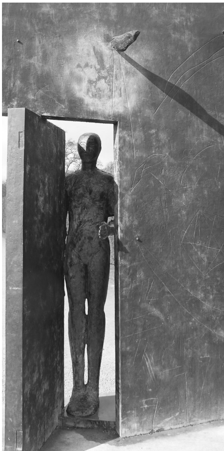
Fig. 1. Mimmo Paladino, Porta d'Oriente, 2005, scultura in bronzo, 345x165x85 cm.