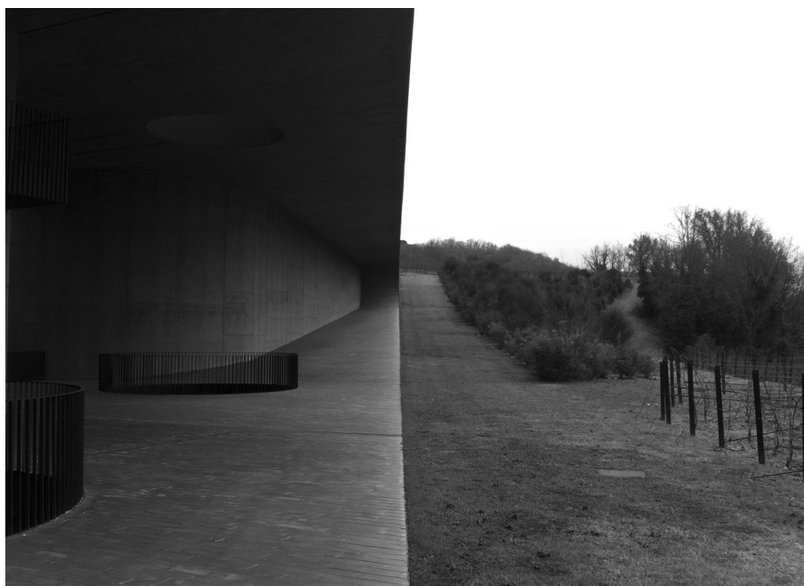
Fig. 2. Archea associati, Cantine Antinori, 2012, Bargino (FI), particolare del margine tra spazio costruito e paesaggio (Sabrina Cesaretti).