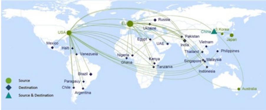
Fig. 2 Mappa dei flussi di rifiuto informatico nel mondo durante l'anno 2019 (J. Okeme e V. H. Arrandale, 2019)

Per questo sono frequenti le soluzioni “abusive” in cui pezzi di hardware gettati nell’indifferenziata o abbandonati in discariche improvvisate contaminano irrimediabilmente l’ambiente circostante e gli esseri umani o animali che vivono intorno (ad esempio, il tubo catodico dei vecchi monitor se rotto può rilasciare sostanze tossiche e/o cancerogene).