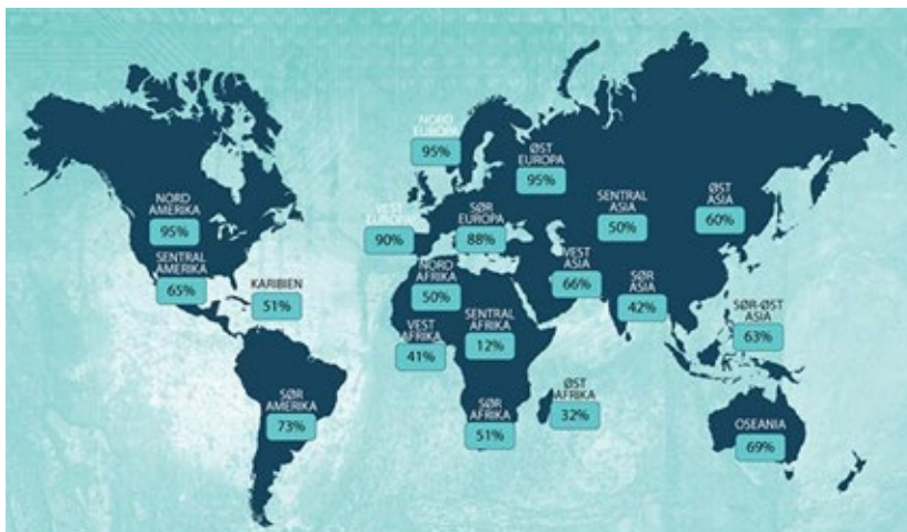
Fig. 4 Mappa estratta da un articolo di government.no che mostra la percentuale di popolazione che ha accesso a Internet nel 2019

modi (dal mancato accesso all'Internet all'incapacità di mantenere un dispositivo). Confrontando la mappa in Figura 2 con la mappa in Figura 4, emerge che, tendenzialmente, i paesi destinatari di grandi quantità di e-Waste e i paesi a maggior divario digitale coincidono.