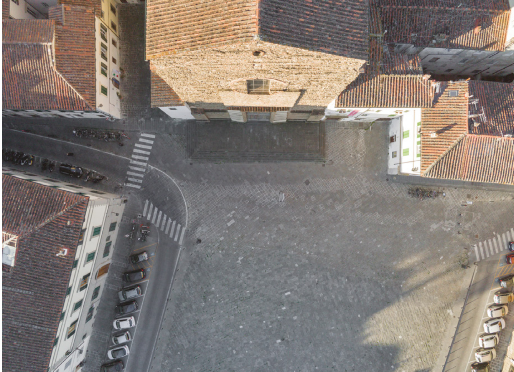
Firenze zenitale Planimetrie di una quarantena Piazza del Carmine