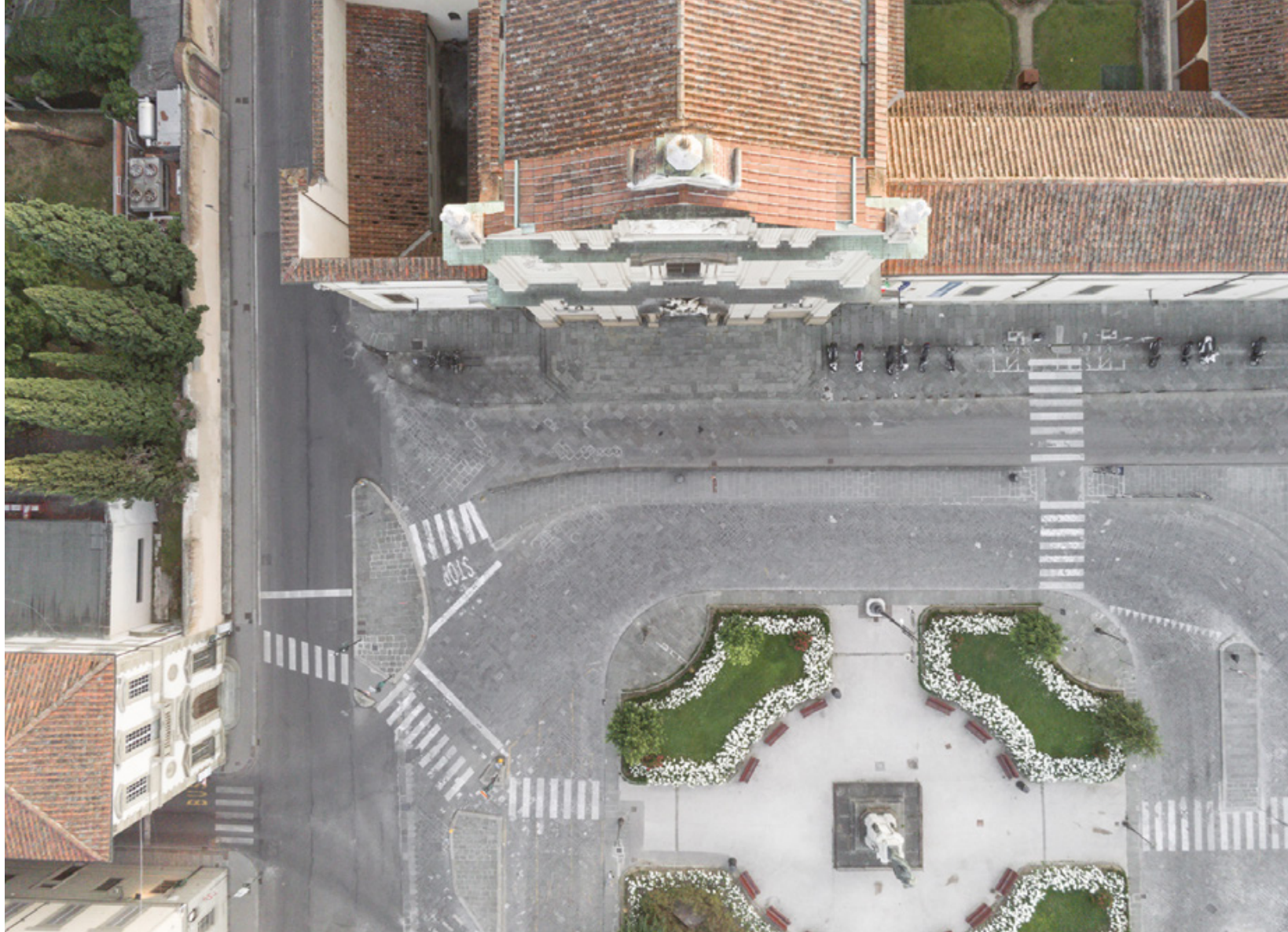
Firenze zenitale Planimetrie di una quarantena Piazza San Marco