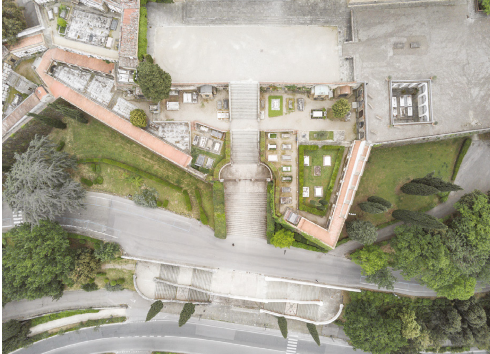
Firenze zenitale Planimetrie di una quarantena San Miniato al Monte