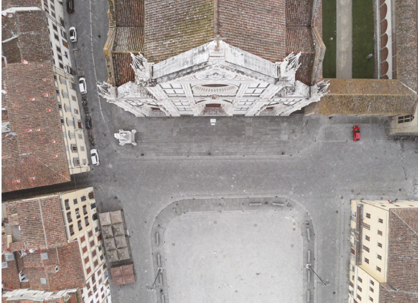
Firenze zenitale Planimetrie di una quarantena Piazza Santa Croce