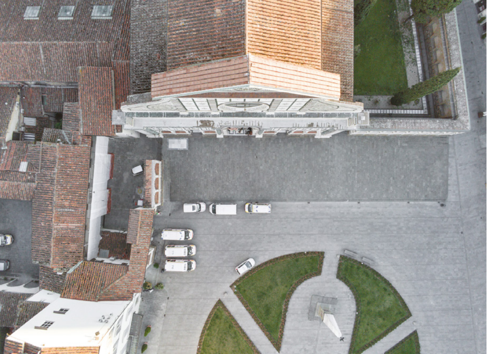
Firenze zenitale Planimetrie di una quarantena Piazza Santa Maria Novella