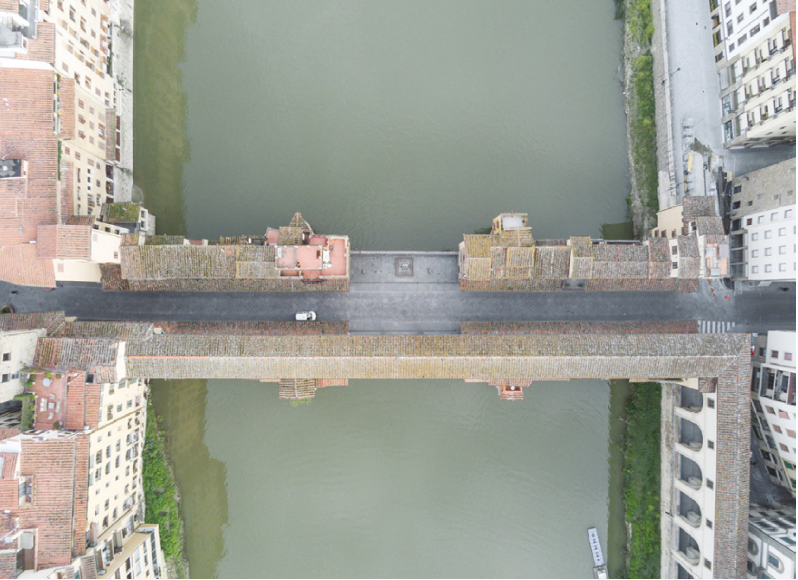
Firenze zenitale Planimetrie di una quarantena Ponte Vecchio