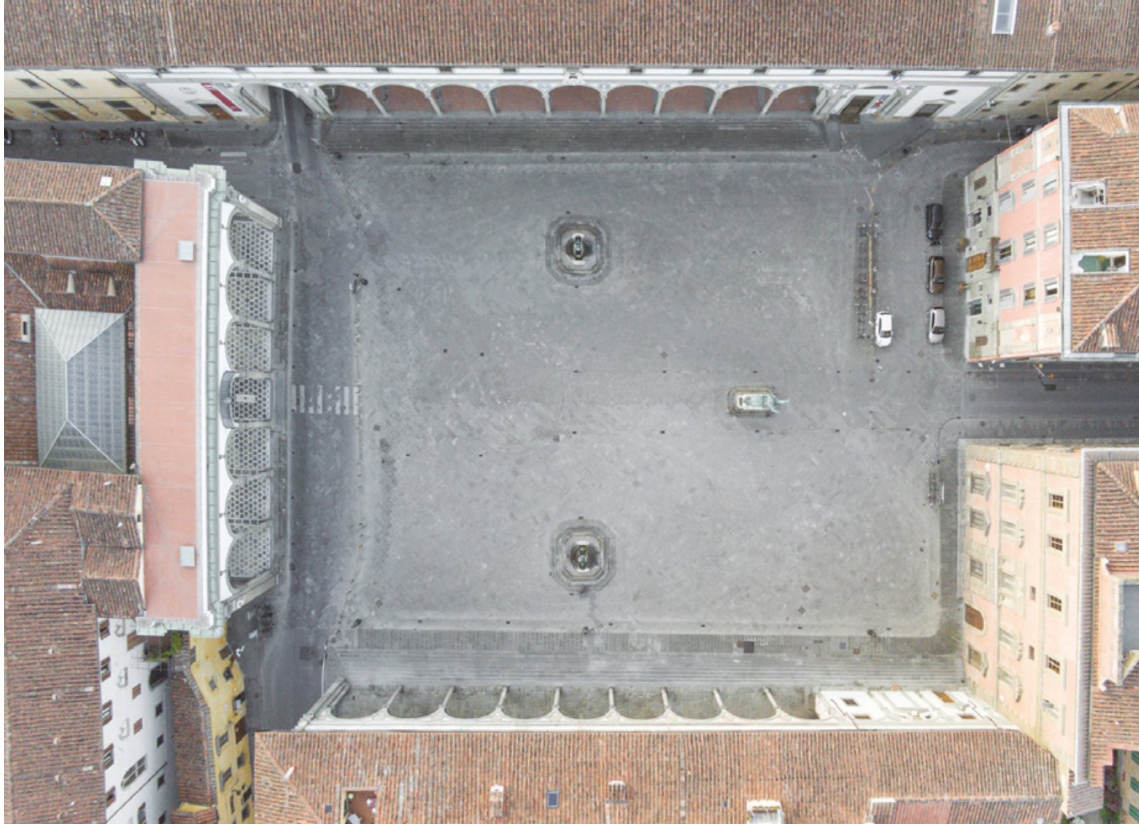
Firenze zenitale Planimetrie di una quarantena Piazza Santissima Annunziata