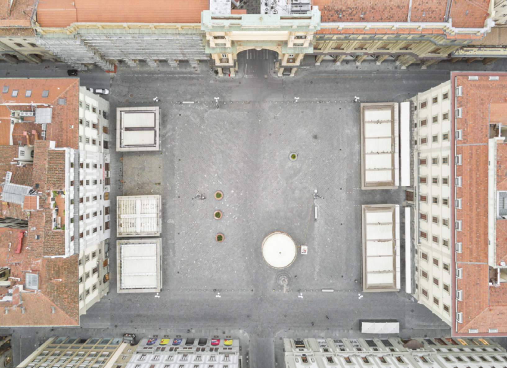
Firenze zenitale Planimetrie di una quarantena Piazza della Repubblica