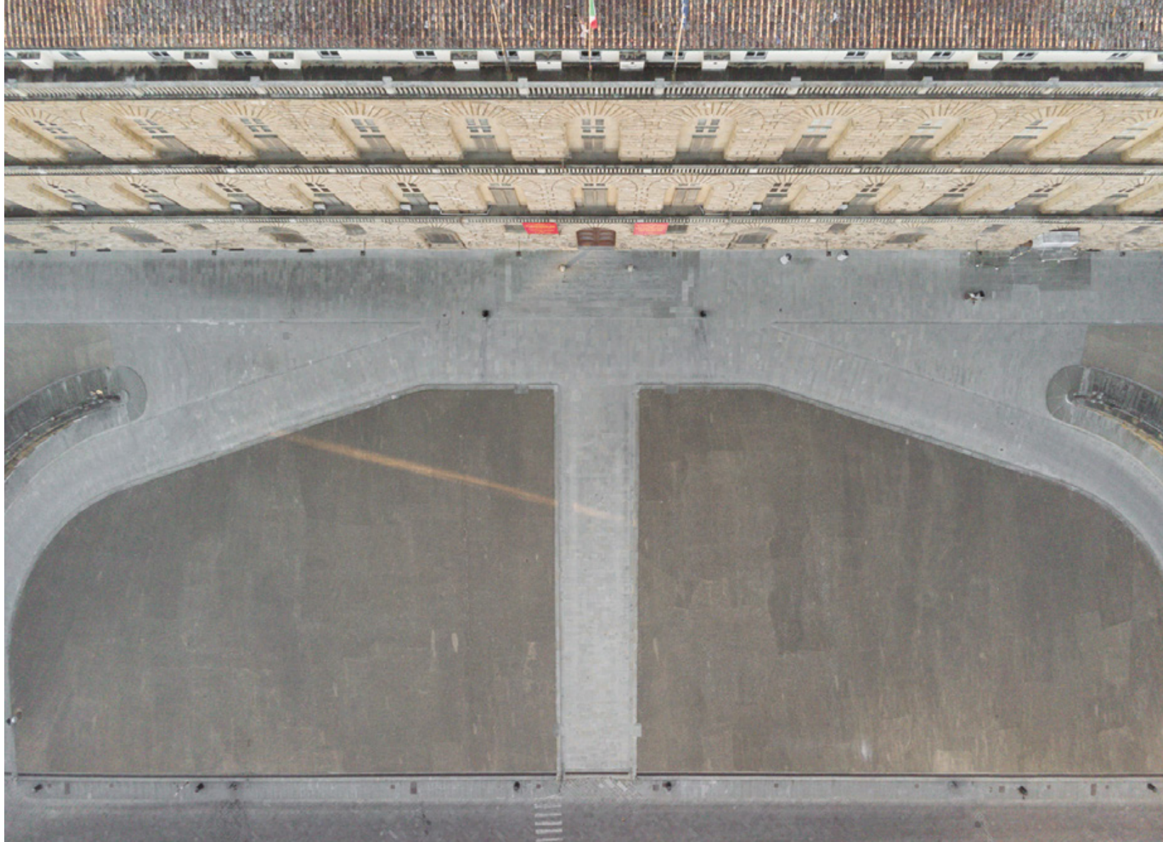
Firenze zenitale Planimetrie di una quarantena Piazza Pitti