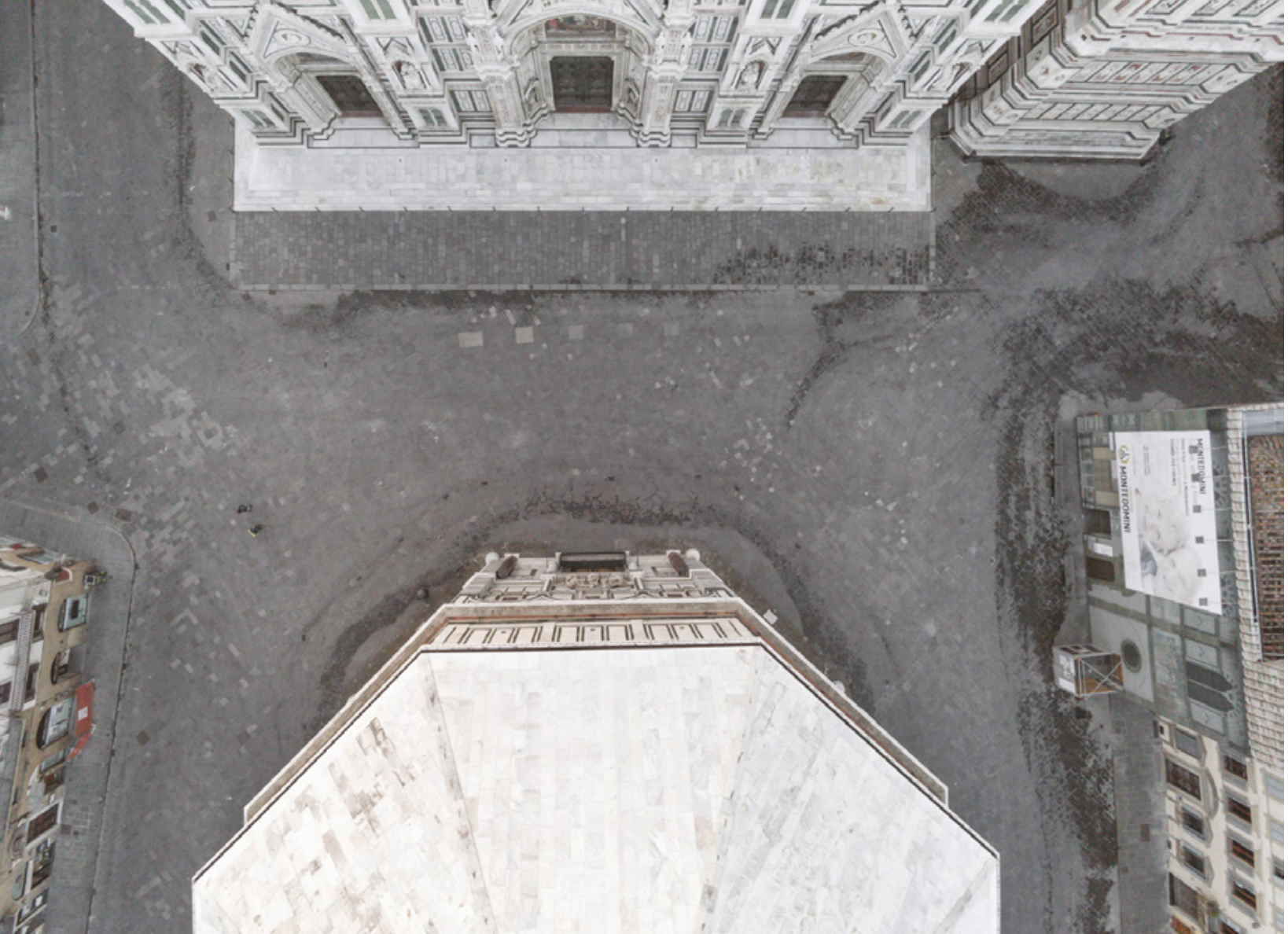
Firenze zenitale Planimetrie di una quarantena Piazza San Giovanni