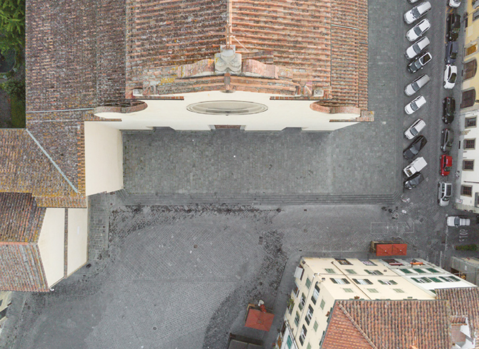
Firenze zenitale Planimetrie di una quarantena Piazza Santo Spirito