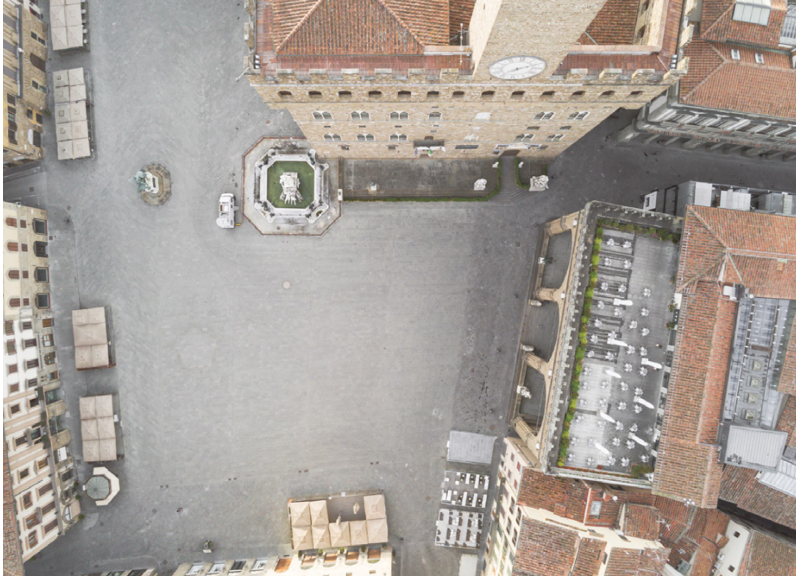
Firenze zenitale Planimetrie di una quarantena Piazza della Signoria