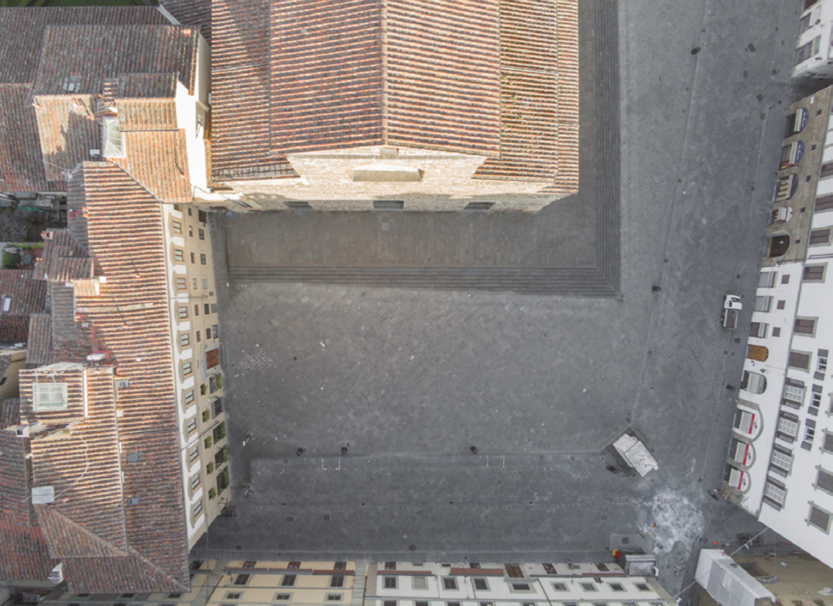
Firenze zenitale Planimetrie di una quarantena Piazza San Lorenzo