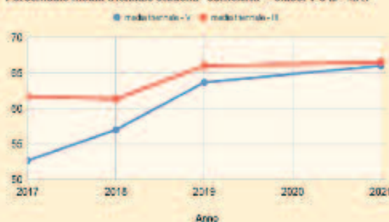
Percentuale media triennale studenti "sufficienti" - classi V e III - MAT