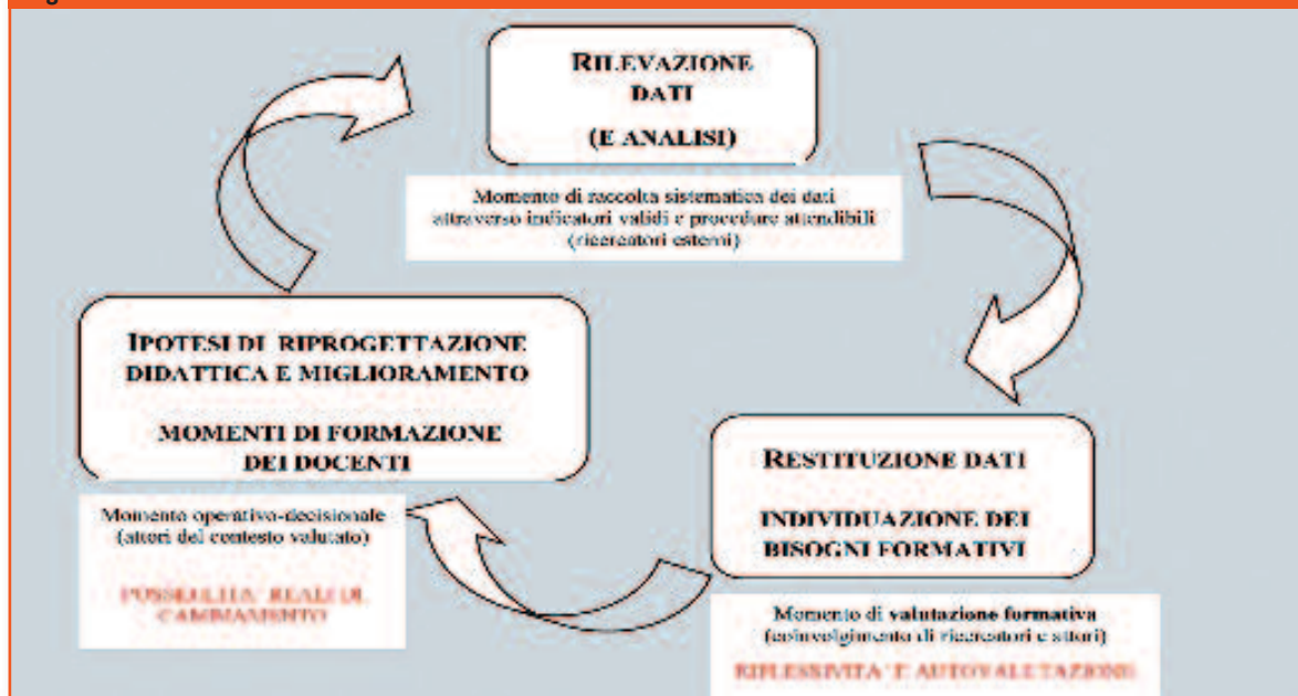
Figura 1 Modello di Formative Educational Evaluation

▶ una riflessione – a livello strutturale di sistema scolastico – su quali siano i fattori che possono realmente garantire la sostenibilità di tali percorsi.