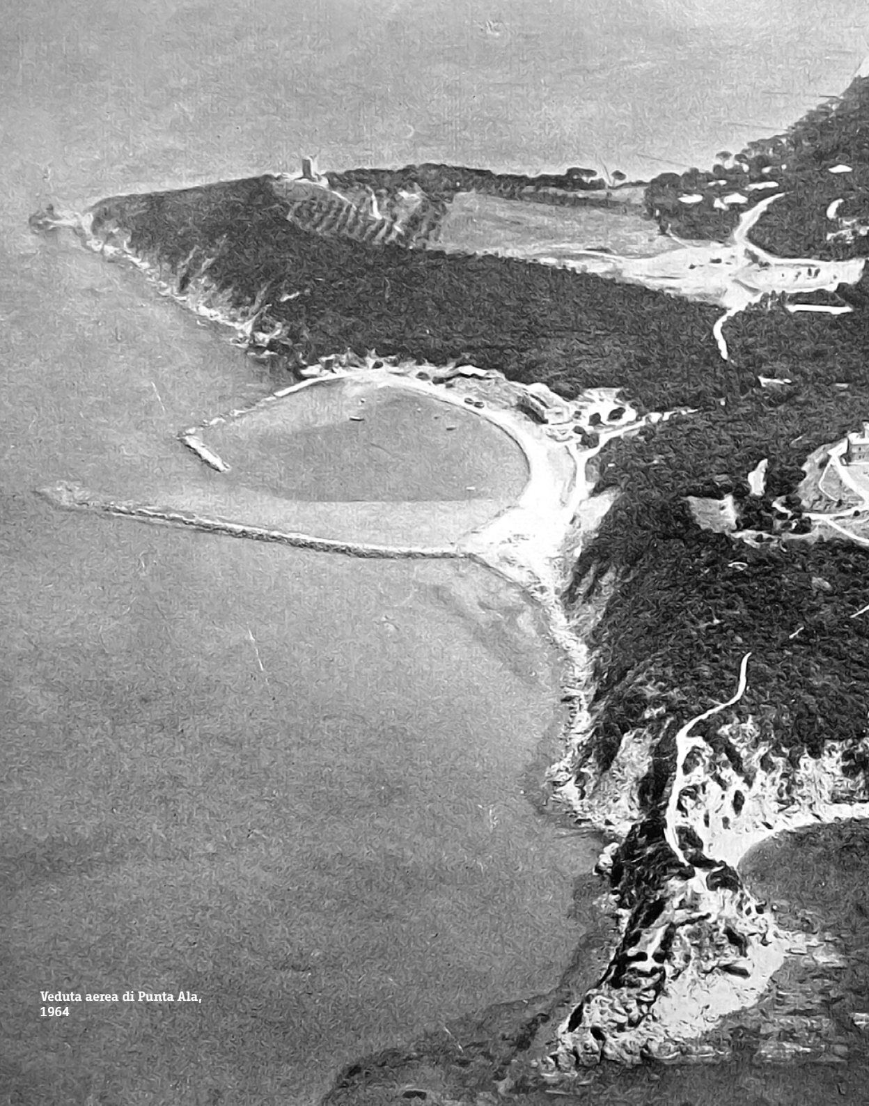
Veduta aerea di Punta Ala, 1964