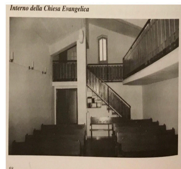
Figura 6, 7, 8, 9. L'interno della ex chiesa a confronto con l'allestimento precedente: foto b/n tratte dal libro I valdesi a San Giovanni ... cit., p. 58; foto credits: per AS-BC Archivio storico e Beni culturali della Tavola valdese, Federica Tammarazio.

Scriva la ex pastora che la vendita del tempio valdese di San Giovanni Lipioni al comune di quella località, con l'intento di trasformarlo in un centro di aggregazione dotato di una sala multimediale, aveva suscitato qualche anno prima tristezza e rammarico tra i pochi valdesi rimasti, e ancor più tra i numerosi loro discendenti lontani con un ricordo mitico del paesino, legato soprattutto alle memorie della loro infanzia [7].