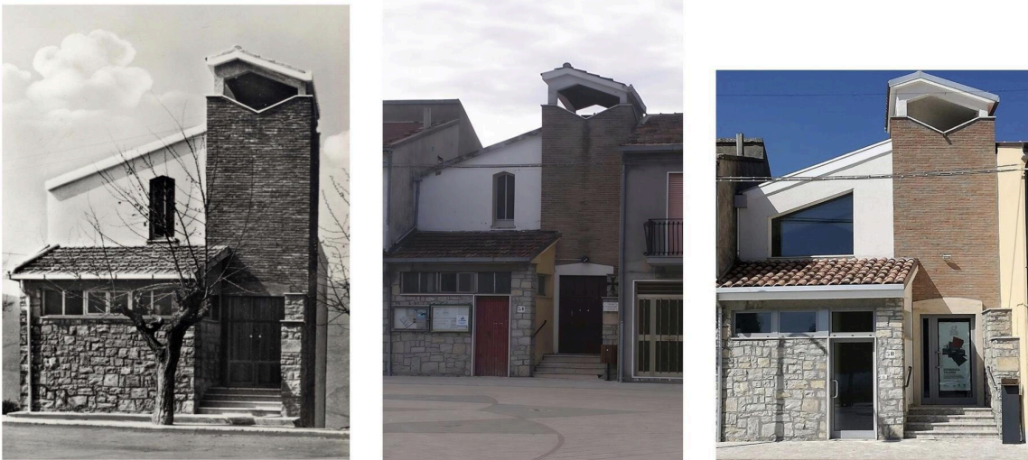
Figura 3, 4, 5. Chiesa valdese San Giovanni Lipioni prima e dopo il restauro del 2014, foto credits: AS-BC Archivio storico e Beni culturali della Tavola valdese.

con l'accesso al tempio, eliminando la presenza dell'albero e del gradino [Figura 4], banalizza quello spazio di transizione che è sempre necessario percorrere prima di accedere a un luogo di culto. Anche l'accesso [Figura 3], marcato da quattro gradini, che evidenziano l'eccezionalità dello spazio, perde e vanifica la sua connotazione nelle successive manipolazioni. L'apertura di una porticina rossa nella piccola sagrestia [Figura 4 e 5] rompe poi l'esclusività dell'accesso, volgarizzando il tragitto verso il culto. Nel rito valdese, infatti, la chiesa è tale solo quando la comunità si trova insieme a leggere e interpretare le Scritture, tanto che gli spazi vengono aperti solo in quella occasione. È evidente la gerarchia degli accessi [Figura 3]: nei mattoni del campanile è stata ritagliata una sottolineatura bianca intorno all'ingresso principale; la macchia della nuova piccola porta, [Figura 4 e 5] anch'essa profilata da una sottile intonacatura bianca, però cattura lo sguardo, distogliendo l'attenzione dal portale. La scelta di coprire la pietra del luogo con intonaco intorno alla rampa di entrata [Figura 4 e 5] toglie la continuità visiva così da trasformare il tragitto verso l'interno in frammentario.